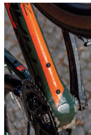
Naspod rámu lze přidat lahev nebo uchytit třeba zámek