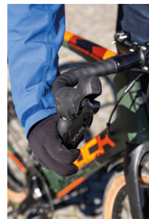
Ergonomické brzdové páky ukrývají hydrauliku