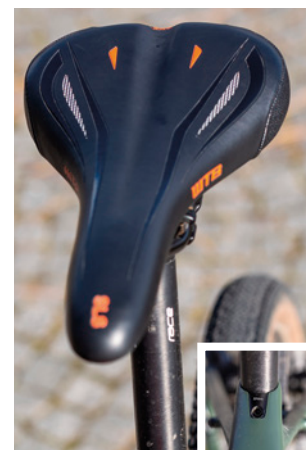
Pohodlné sedlo na karbonové sedlovce s integrovaným úchytem

nost kolem deseti kilogramů a v podstatě silniční geometrie s relativně velkým rámem umožňují po přezutí pneumatik na kole i amatérsky závodit na silnici i v cyklokrosu. Pokud to do školy či do práce máte přes les nebo po cyklostezce bez asfaltu, můžete si být jisti, že tam GravelRide bude jako doma. Jízda po šterkových cestách je skutečně jeho hlavním posláním a umí to nejlépe ze všeho. ■